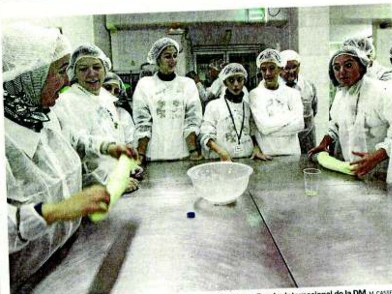
Los jóvenes en un taller de pan como parte del programa I Congreso Escolar Internacional de la DM. M. CASERÓN