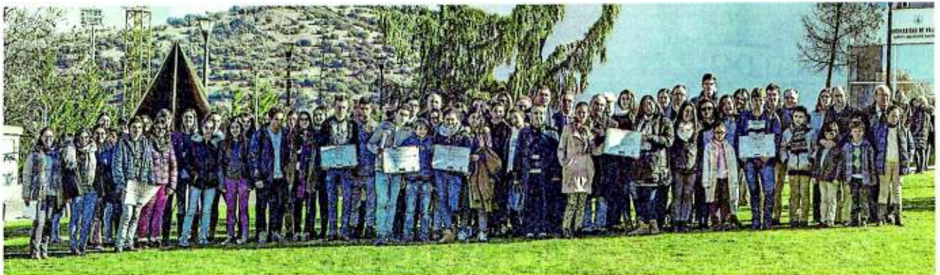
Los participantes que ayer estuvieron en el cierre del I Congreso Internacional Escolar de las Comunidades Emblemáticas de la Dieta Mediterránea posaron juntos.