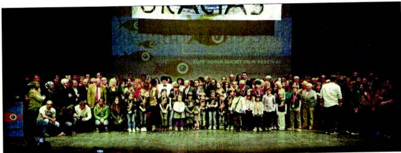
Foto 'de familia' en la gala de clausura del Certamen de Cortos. ALVARO MARTÍNEZ