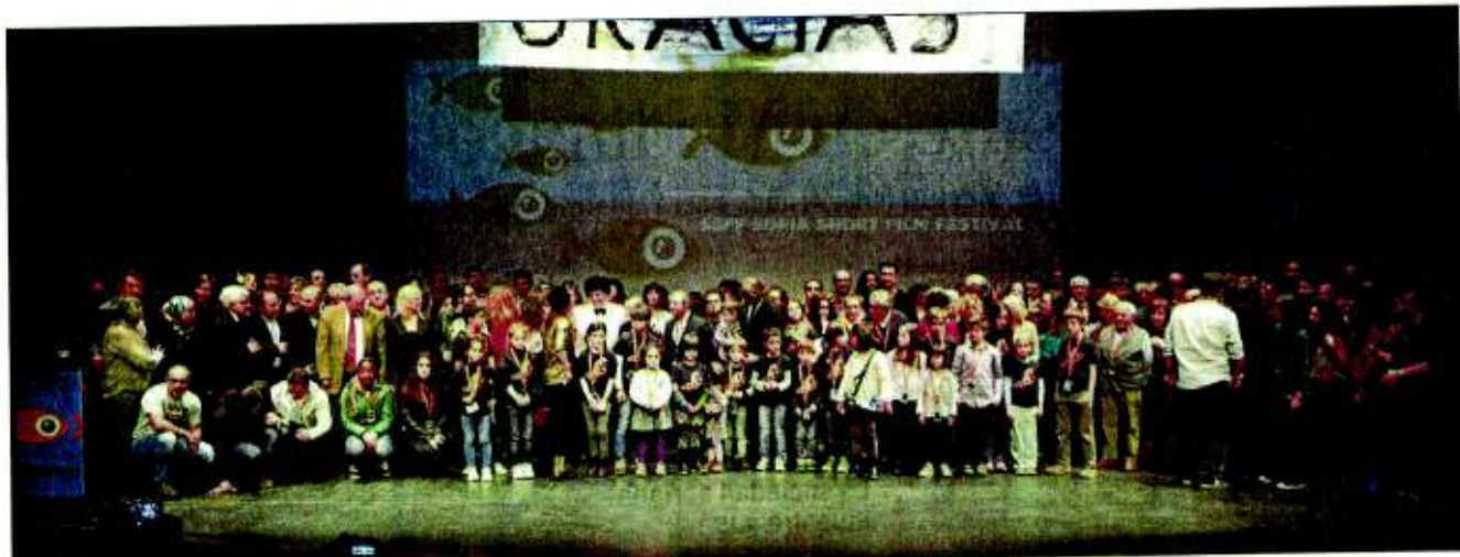
Foto 'de familia' en la gala de clausura del Certamen de Cortos. ALVARO MARTINEZ