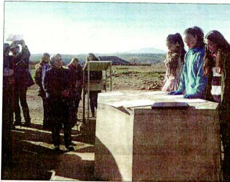
Lectura de un manifiesto por parte de escolares de España, Portugal y Marruecos, ayer, en Numancia.