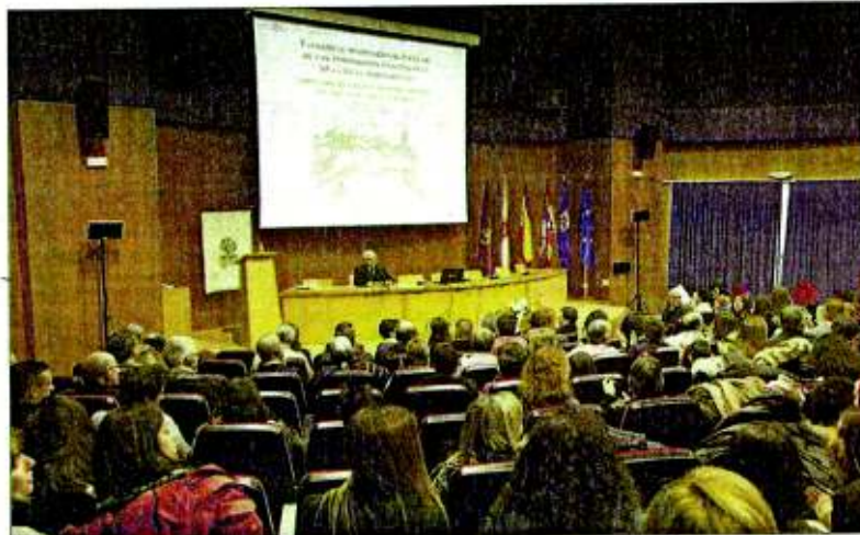
Clausura del Congreso Internacional Escolar surgido en Soria.

«Reunidos en la Ciudad de Numancia (Soria), los representantes más jóvenes de las Comunidades Emblemáticas de la Dieta Mediterránea, queremos que este emblemático lugar celtibérico-romano sea aquel en el que suscribimos