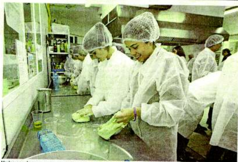
Varios escolares preparan pan, en una de las demostraciones prácticas del congreso.

Aunque son jóvenes, tienen muy claros los beneficios que aporta la Dieta Mediterránea, un estilo de vida saludable que son capaces de argumentar y defender, como se está demostrando en el encuentro organizado por la FCCR. Unos 70 escolares de 12 a 16 años de Portugal, Grecia, Marruecos y España participan hasta mañana en el congreso de Soria. PÁG. 6