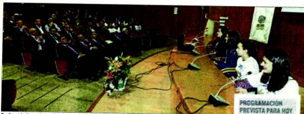
Conferencia de escolares sobre la dieta mediterránea ayer en el campus de Soria.